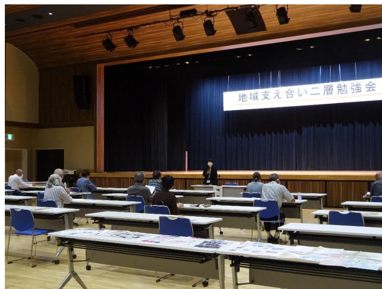
支え合い活動を行う為の勉強会の様子