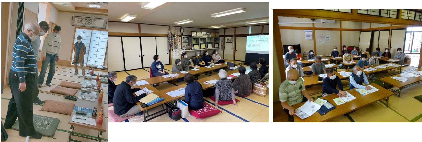
令和3年度各自治会での開催の様子

市民のみなさんの学習会とみなさんの声を福祉活動に反映させるため、福祉座談会を各自治会で開催しております。