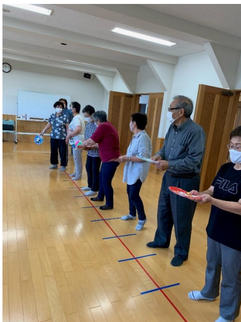
うちわの上でボール運びをしている様子

60歳以上の方5人以上で自宅から歩いていける場所に集まり仲間づくりを通じて生きがいをもってもらうことを目的としてサロンの開催を支援しています。