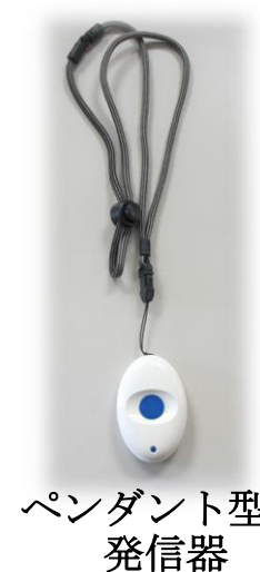
ペンダント型 発信器