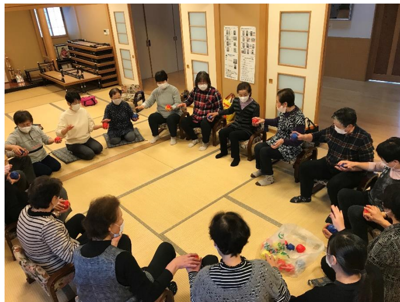
ボール回しをしている様子