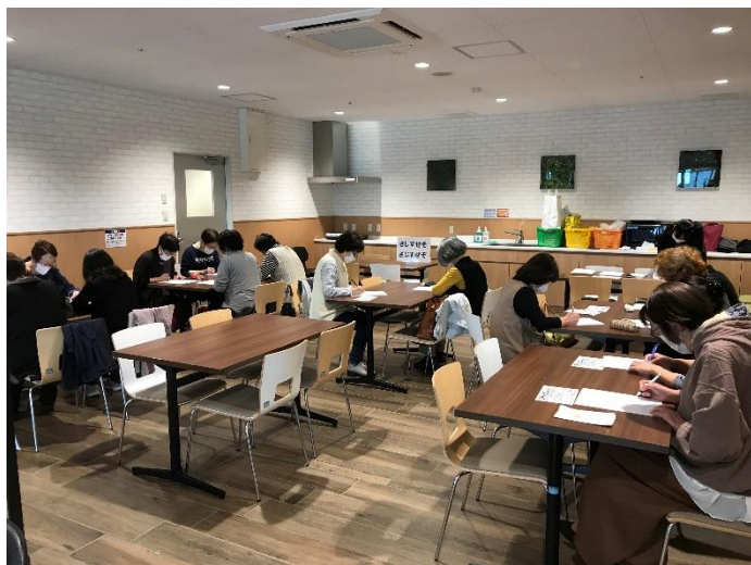
追分のいづく2階にて 脳トレをしている様子

誰もが住みなれた地域で、安心して暮らし続けるための支援体制を図っていくことを目的としています。