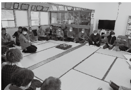
福祉座談会(天王地区 二田三区)