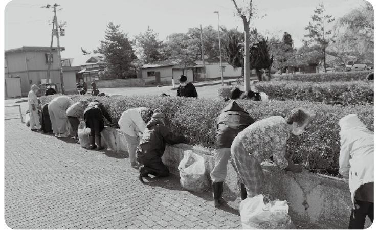
草取り奉仕活動（大豊小学校）