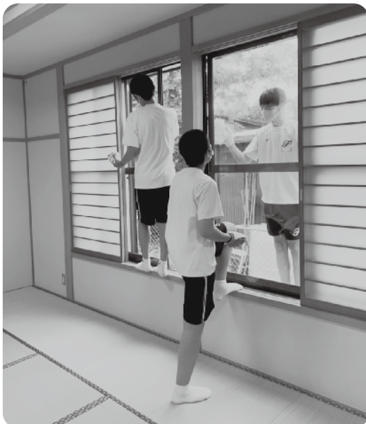
公共施設清掃活動 (天王南中学校)