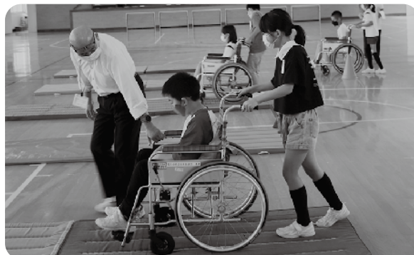
車イス体験 (天王小学校)

潟上市社会福祉協議会では、社会における複合的な課題、関係性の貧困、制度の狭間のニーズ等にアプローチし、どのような相談も受け止め、市民誰もが安心して暮らせる「人とひととがつながる地域づくり」を推進します。