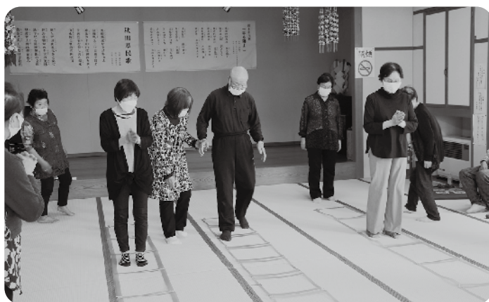
天王地区 羽立サロン