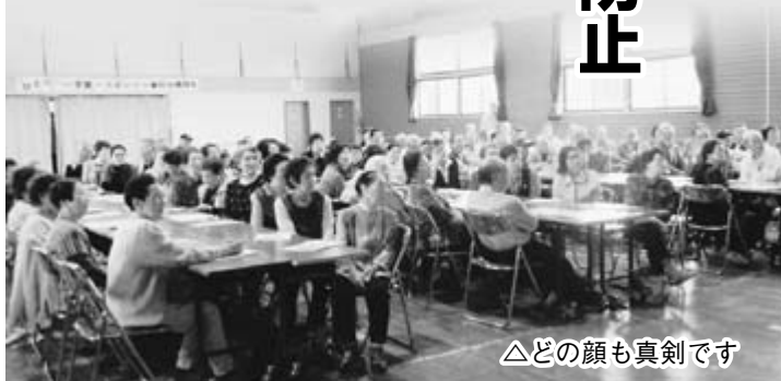
△どの顔も真剣です

この日は、五城目警察署交通課、生活安全課の警察官を講師に招き高齢者の交通事故と特殊詐欺防止について学びました。