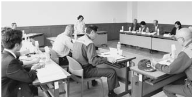
△ネットワーク会議