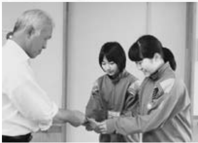
△天王中学生代表から義援金

熊本地震に対して寄せられた義援金は、湯上市共同募金会を通じて、熊本県共同募金会に送金されました。