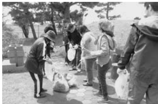
△広げよう、ボランティア

5月26日、天王つくし苑の利用者・職員が出戸浜海水浴場のクリーンアップを行いました。海岸沿いには、流れ着いたゴミや、海水浴場を訪れた人たちが持ち帰らずに投げ捨てたゴミが多く落ちており、用意した袋はすぐにいっぱいになっていました。