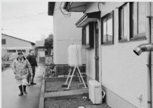
△ ボランティアで外回りの点検

二月十七日に昭和地区、十八日に天王地区、十九日に飯田川地区で、一人暮らし高齢者世帯を対象とした「安全パトロール」が実施されました。この日は、社協職員といっしょに電気工事協同組合、建築組合の方々のご協力をいただき、ストーブやガス台周り、電気配線、住宅補修などの点検を行いました。