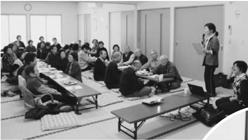
△健康が一番の関心事

TEL (018) 877-2627 FAX (018) 854-8251 有線 3028