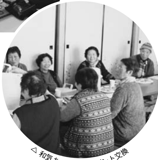
△和気あいあいプレゼント交換

毎日の何気ない出来事などを 楽しく語り合う 気軽に集まり、地域がつながる ふれあいサロンで今日も元気で