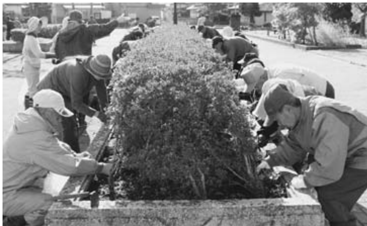
△ 地域のため、自分のため。できるところから。