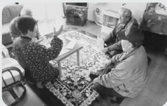
△ 「声かけてもらってありがたいです。話はつきない様子。」

訪問先の方々からは、「戸の立てつけが悪いのを、直ぐに直してもらい助かった」「社協の職員に悩みごとを聞いてもらい気持ちが落ち着いた」「電気の配線は、普段自分で点検しないので、見てもらって安心した」と訪問先の方々から、好評をいただきました。