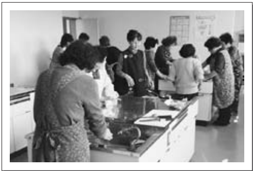
△楽しく生きる 一会食準備も和気あいあい

潟上市母子寡婦会では会員を募集しております。 問合せは潟上市母子寡婦福祉会 877-2627へお電話ください。