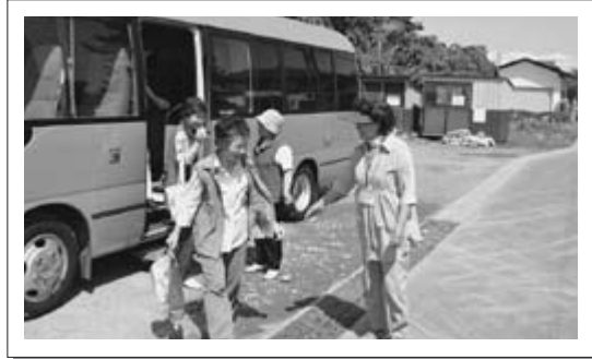
△ボランティアの一声ににっこり