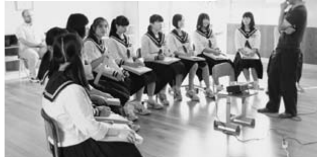
△ボランティアを語る(羽城中学校)