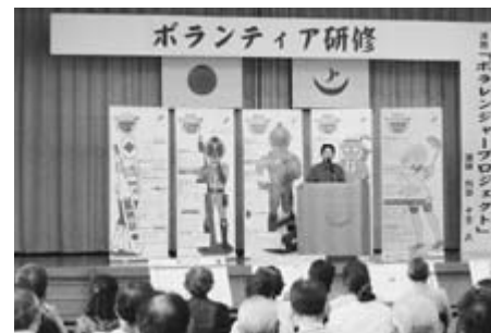
△広げよう、ボランティアの輪