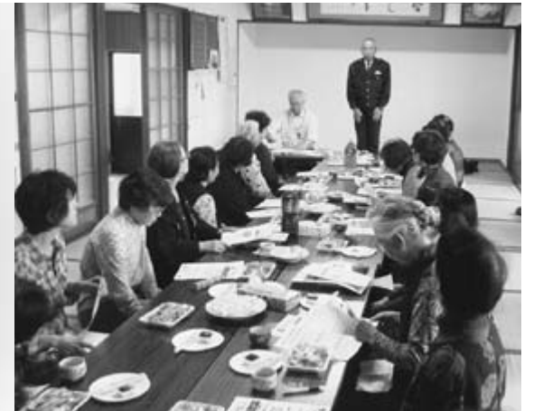
△今回のテーマは「特殊詐欺」