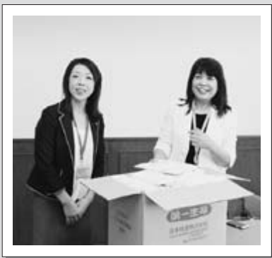
△第一生命職員からタオル

第一生命労働組合・秋田営業職支部南秋男鹿分会では、毎年、社会貢献活動を行っています。今年、組合員がタオルを持ち寄り、地域の社会福祉協議会に寄贈することとして、このほど当社協に百本のタオルが届けられました。