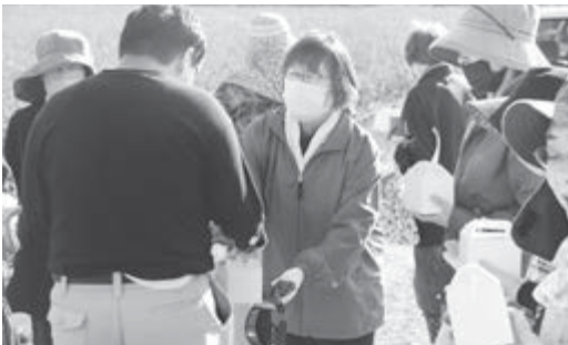
ボランティアのお礼にお菓子をいただきました

10月10日(火)から13日(金)にかけて、潟上天王つくし苑にて、市内のボランティア団体の有志が、つくし苑の職員や利用者の皆さんと共に、イチゴの苗植え作業を行いました。