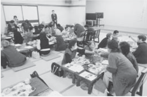
久しぶりの乾杯に笑顔がこぼれました

この事業は、市内に住む70歳以上の一人暮らしの方が、日頃の悩みや不安を話し合いながら、互いに親睦を深めることを目的に、年1回実施しているものです。今回は4年ぶりに、会食をともなつての開催となりました。懇談や入浴など、皆さんそれぞれ思い