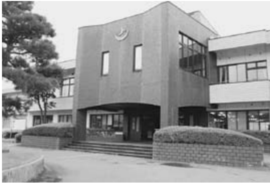
△ 社会福祉協議会飯田川センター

当社協は、平成28年10月3日から飯田川出張所(旧飯田川庁舎)に社協本所を移転して福祉拠点としての位置づけで業務を進めてきましたが、社会の変化や要望に応じて、さらに市民に期待される社協として体制整備を進めていく必要があります。 このことから本年7月を目途に現在の昭和センターを社協本所に移転して、より福祉推進の機動力を高めていくために、現在、昭和地区における各団体と移転に関して協議を重ねています。