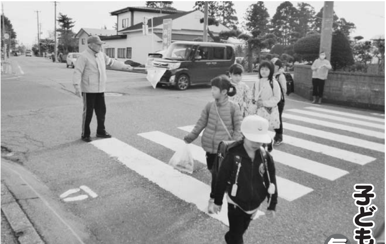
△子どもたちの安全をしっかり守ります

TEL (018) 877-2627 FAX (018) 854-8251 有線 3028